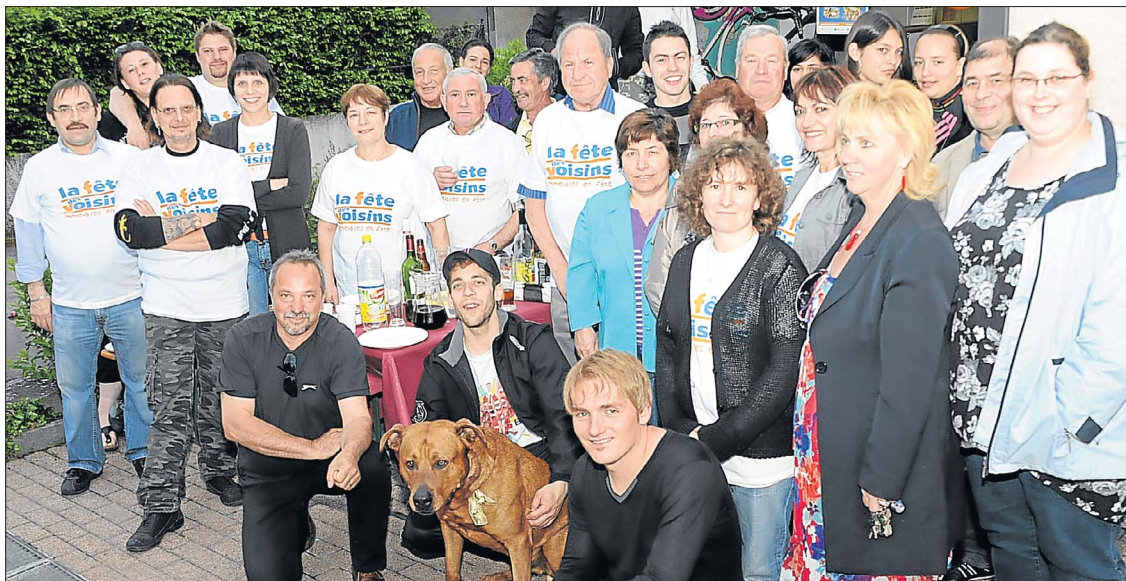
A Festa dos Vizinhos reuniu, na sexta-feira, em Esch/Alzette (foto) e em muitas outras localidades do Luxemburgo e da Europa, pessoas diferentes pelas origens, mas iguais pelo que partilham