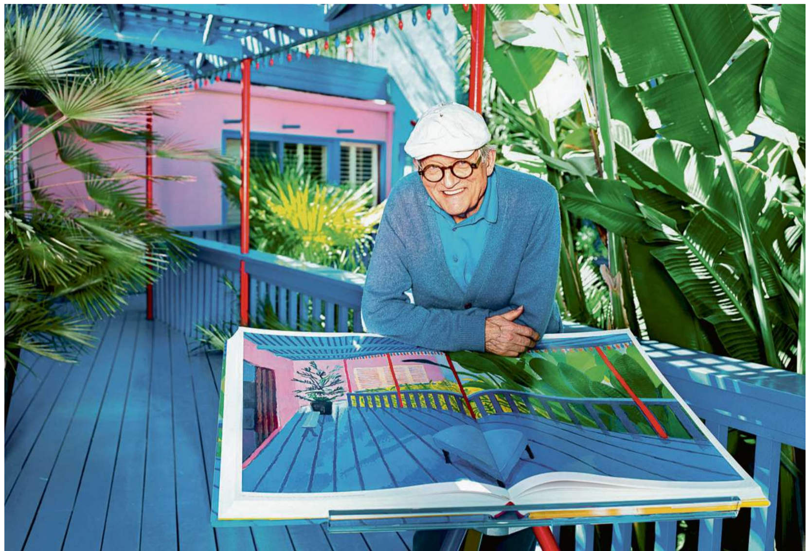
David Hockney avec son «Bigger Book» chez lui, à Los Angeles

Parfois, l'humain a déserté le tableau mais sa présence se devine aux objets laissés derrière lui (parasol, vêtement sur un fauteuil), à d'autres moments, c'est l'artiste