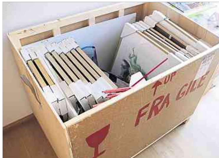
Une caisse de voyage, emblématique d'une artiste entre deux cultures.

Elle regagne alors le deuxième étage de son atelier d'où elle peut scruter la course des nuages, se brancher sur la radio 100.7 («avec laquelle j'ai appris le luxembourgeois») et se met au travail: «C'est le moment où je suis la plus créative». L'après-midi, elle s'occupe à des travaux qui demandent moins de concentration. Ses soirées sont consacrées aux cours de dessin qu'elle dispense à des adultes à Hesperange et Bonnevoie. Une vie rythmée, ordonnée, comme pour mieux corseter une sourde inquiétude qui ne trouve d'échappatoire que dans ses toiles.